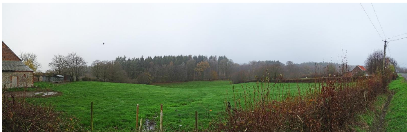
Illustration de la vue :