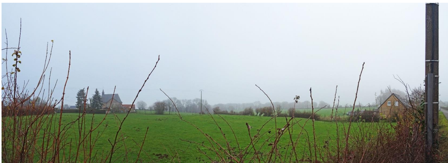
Illustration de la vue :