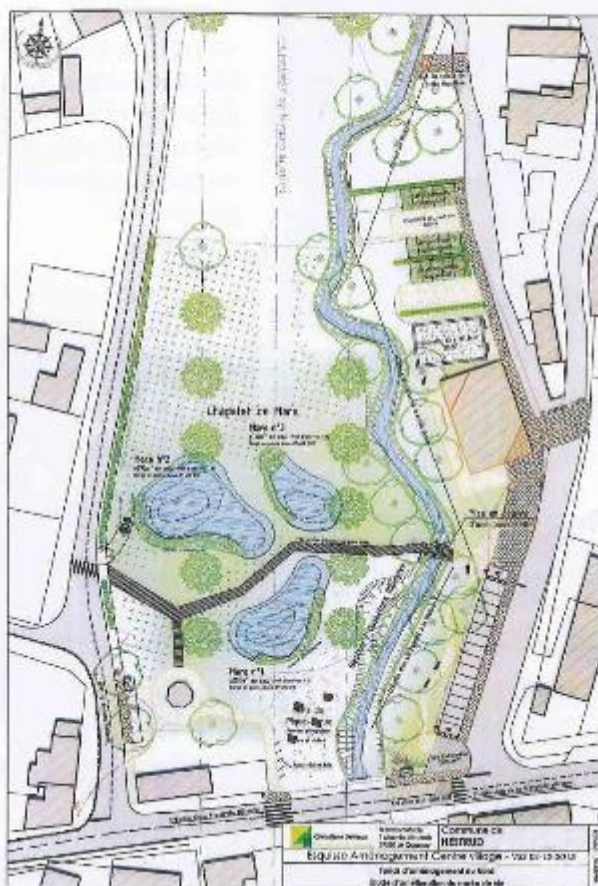
Extrait du journal municipal de 2016

Cette étude est pratiquement terminée. La dernière réunion est prévue le 25 janvier et une présentation à la population aura lieu en mars.